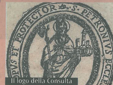
Il logo della Consulta